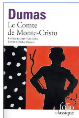
Alexandre Dumas, Le Comte de Monte-Cristo , Folio classique, édition 2020.

Vous devez vous procurer ces deux romans dans l'édition indiquée (essentielle car nous devons suivre la même pagination durant le cours).